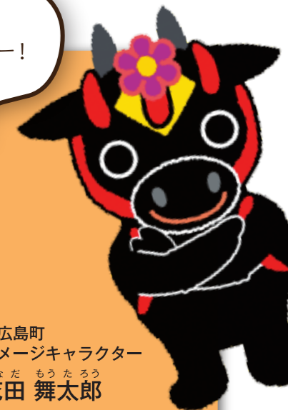
北広島町 イメージキャラクター はなだ もうたろう 花田 舞太郎

これが「第2次北広島町長期総合計画」の全体像だモー。 さて、どんな計画なんだろう。次のページから、探ってみるんだモー！