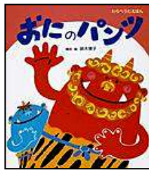
ひさかたチャイルド