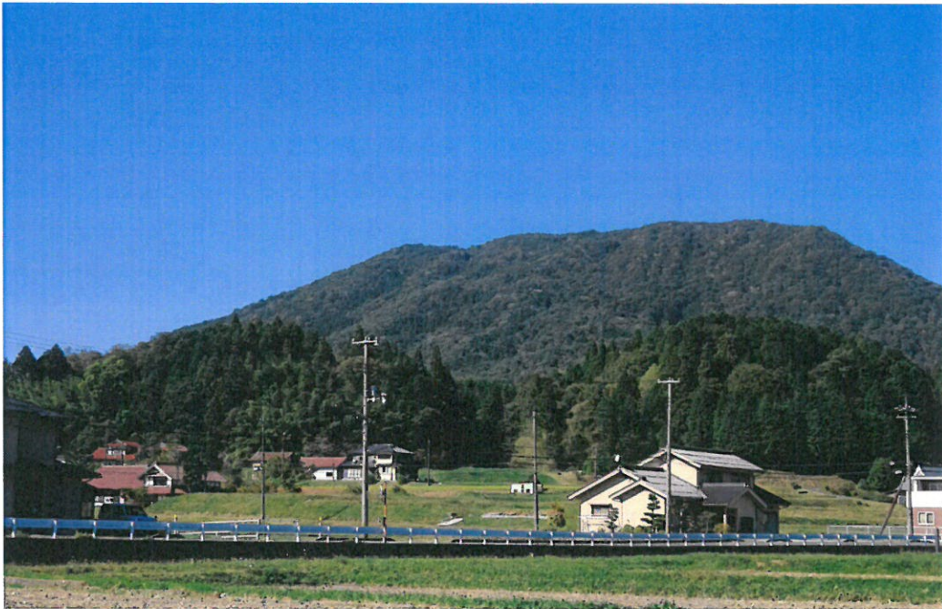
国史跡 駿河丸城跡（北広島町大朝 背後は寒曳山 手前左：西郭群、同右：東郭群）

駿河丸城は中世吉川氏の発展過程を示す三つの城跡と館跡、寺跡からなる「吉川氏城館跡」の一つとして、昭和61年（1986）に国の史跡に指定されました。