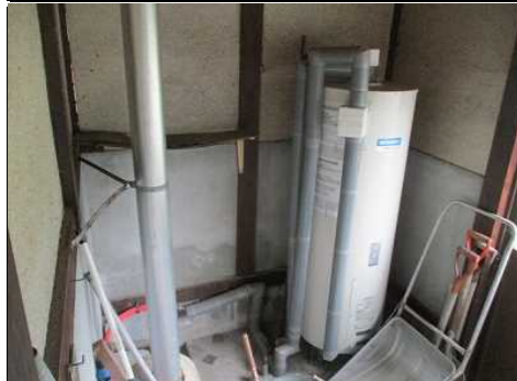
薪ボイラー 温水器