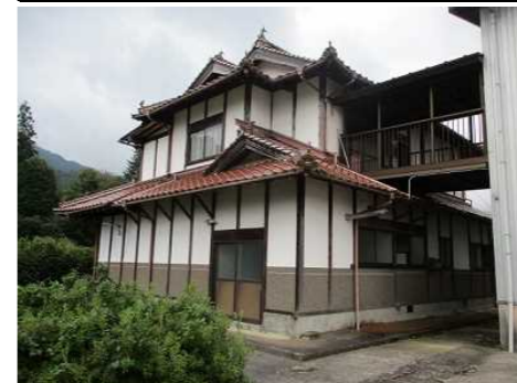
外観主屋と倉庫の繋 東側