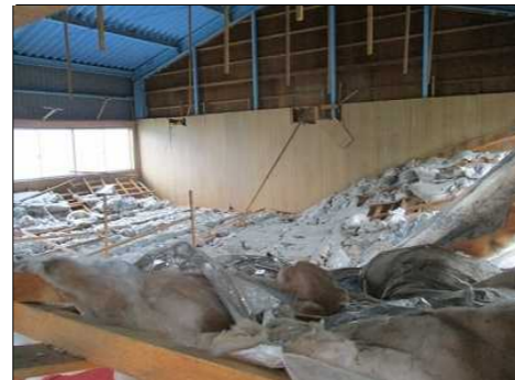
倉庫2階天井落下状況