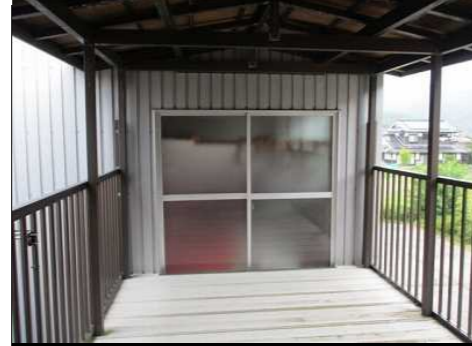
2階 渡り廊下 倉庫