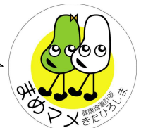
北広島町健康増進計画 公式キャラクターまめママ