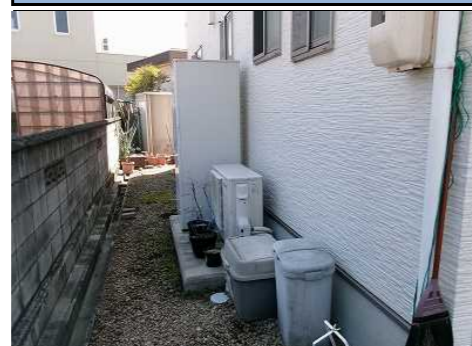
エコキュート設置状況