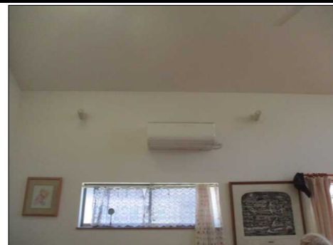
LDKエアコン設置状況