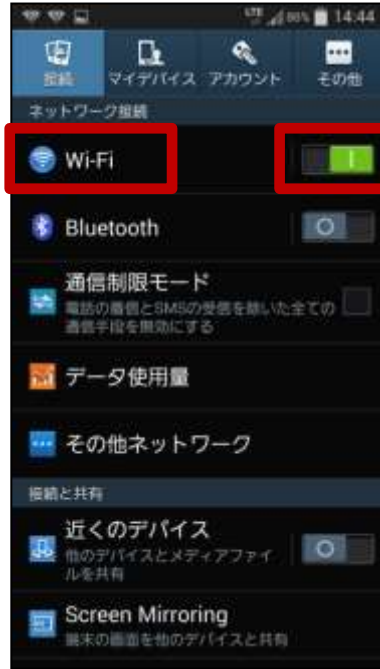
②Wi-Fiを有効にします ③Wi-Fiをタップ