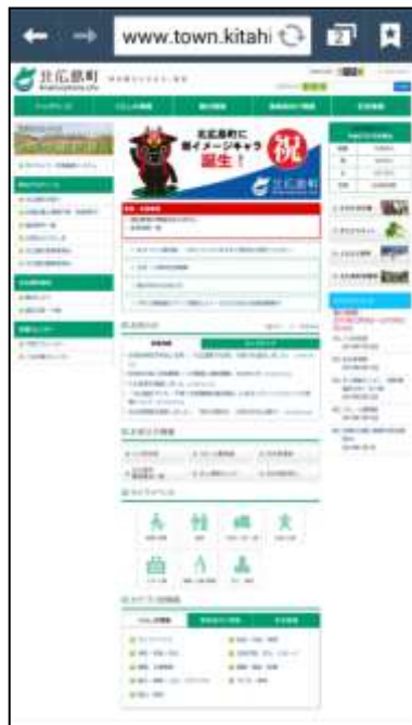
⑥スタートページが表示されます