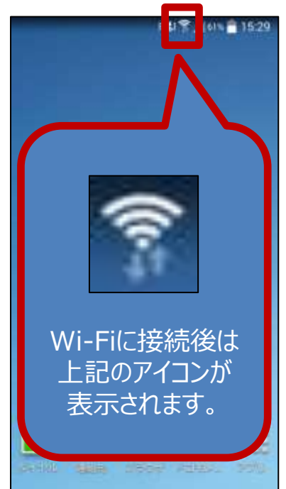
以降はインターネットを ご自由にお使いください