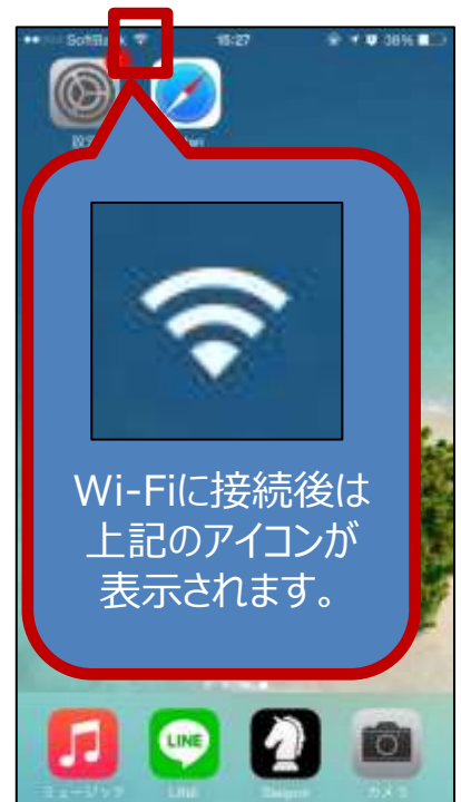
以降はインターネットを ご自由にお使いください