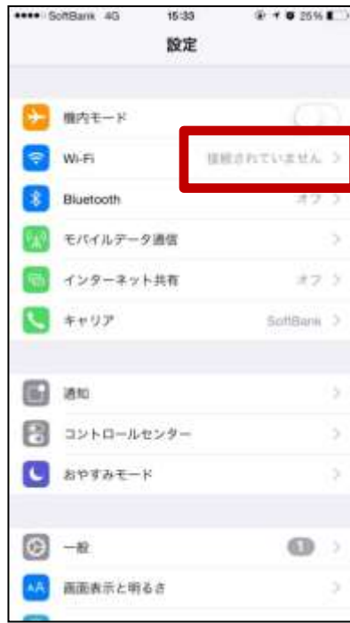
②接続されていません をタップ