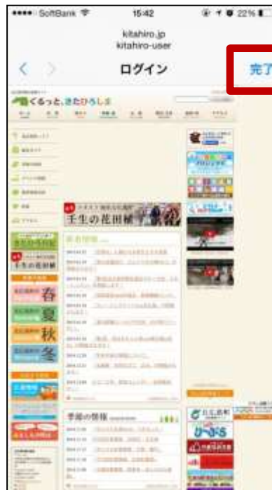
⑥スタートページが表示されます ⑦完了をタップ