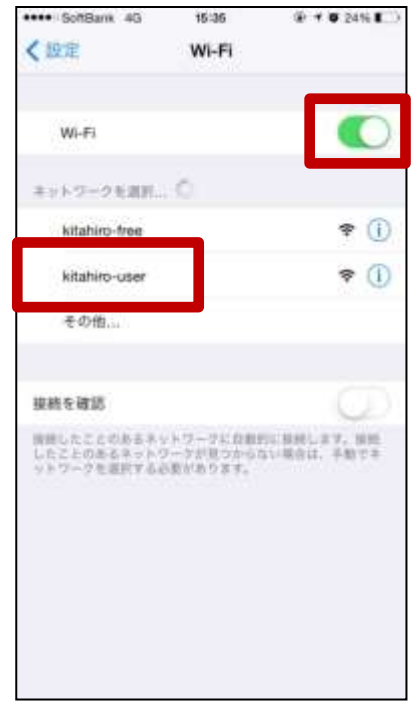
③Wi-Fiを有効にします ④kitahiro-userをタップ