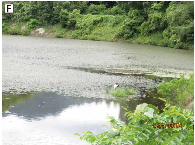
A: 水田で採餌するコウノトリ 2017年5月31日 下市地区水田 B: 樹上で休息するコウノトリ 2017年5月31日 下市地区水田 C: ねぐらに就くコウノトリ 2017年7月2日 下市地区北広島町図書館 D: 飛翔するコウノトリ 2017年8月2日 安芸高田市吉田町 E: カエル類を捕食するコウノトリ 2017年8月3日 郷の埜地区公園 F: 魚類を捕食するコウノトリ 2017年8月3日 田中原地区沈砂池