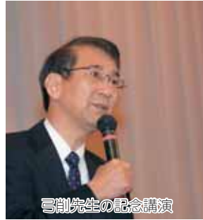
弓削先生の記念講演