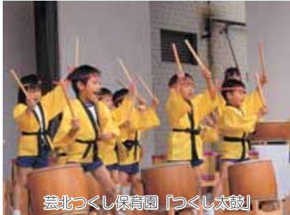
芸北つくし保育園「つくし太鼓」