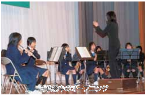
千代田中のオープニング