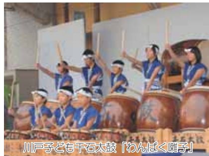
川戸子ども千石太鼓「わんぱく獅子」