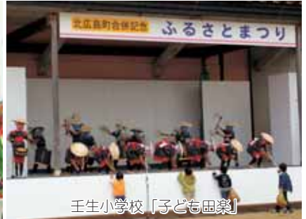
壬生小学校「子ども田楽」