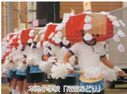
本地小学校「花笠おどり」