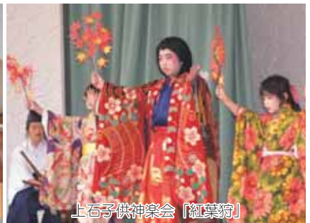
上石子供神楽会「紅葉狩」