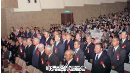
町長感謝状贈呈者