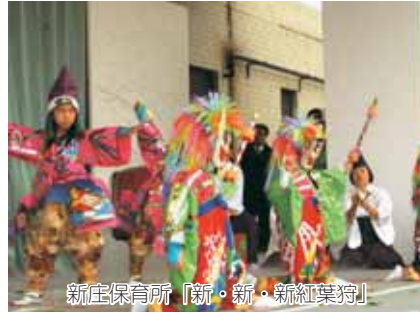
新庄保育所「新・新・新紅葉狩」