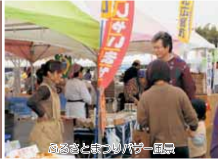
ふるさとまつりパザー風景