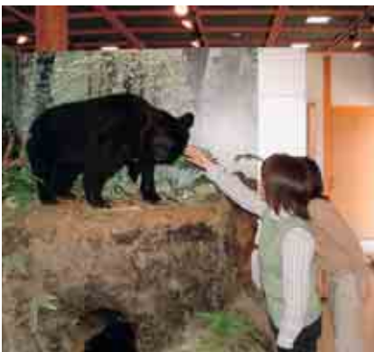
▲ 芸北 高原の自然館