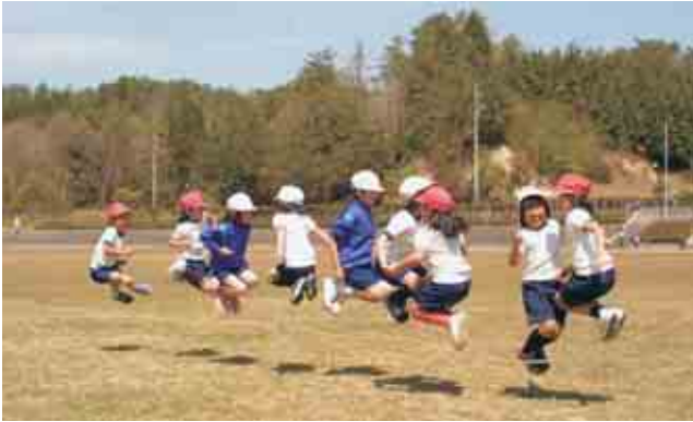
▲ 八重小1・2年生の遠足風景（千代田運動公園）

町長が、教育、芸術・文化等に 対して識見を持つなど経験豊かな人 を、年齢・性別・職業などに偏りが ないように考えて、町議会に相談し、 承認を得てから任命します。 任期は、基本的には4年（一度に 交替しないよう、毎年1から2名の 任期がくるようになっていく）です。 5名の委員の中で、 教育委員長・教 育委員長職務代理者・教育長の3名 は、委員の中から、選任または互選 で決定します。