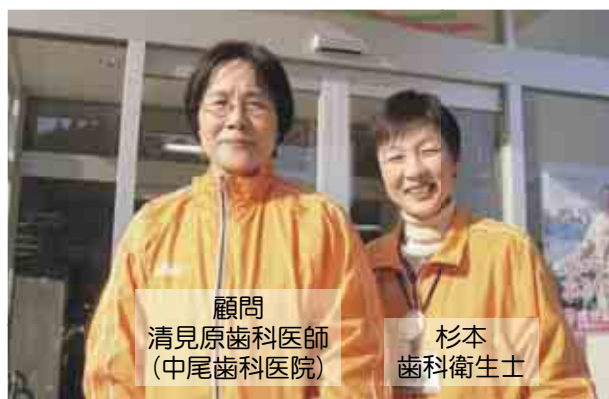
顧問 清見原歯科医師 (中尾歯科医院)