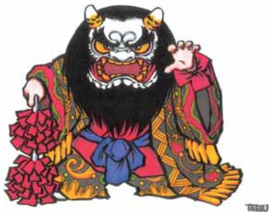
舞ロードIC千代田 マスコットキャラクター千代丸