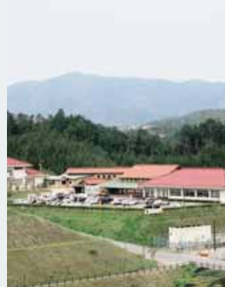
▲道の駅 豊平どんぐり村