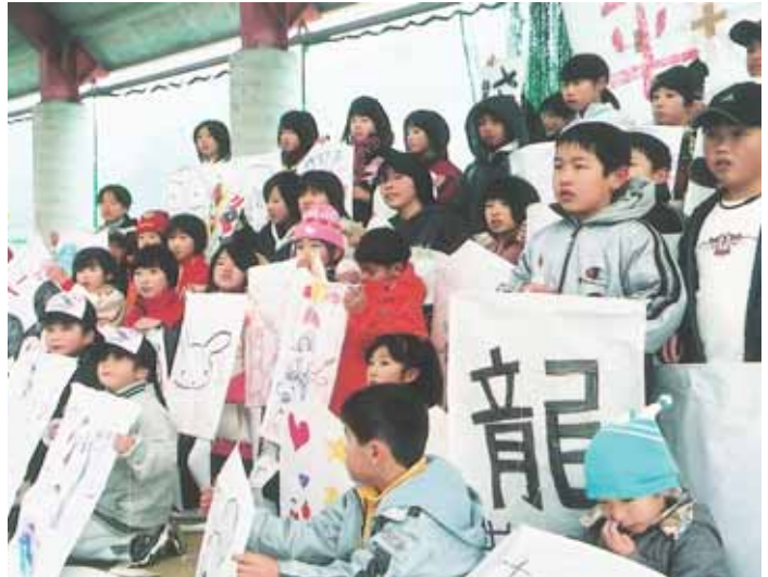
アニメのキャラクターや、新町への夢を絵にしたたこが並び