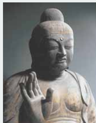
▲古保利薬師(本尊薬師如来座像)