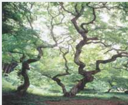
▲大朝のテングシデ群落