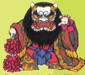
舞ロード・マスコットキャラクター「千代丸」