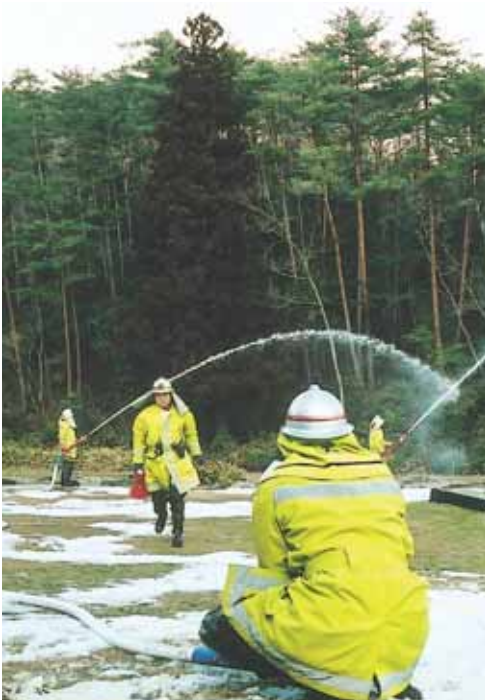
駆けつけた消防車からの放水