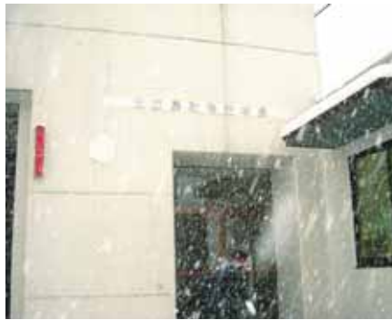
千代田にある消防本部では、玄関にある消防署銘板が除幕された。