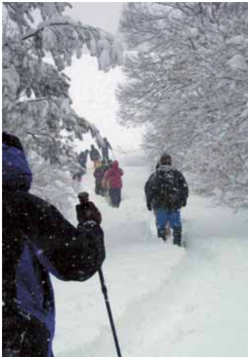
参加者たちは、雪踏み音を連ねながら約2キロを歩いた。