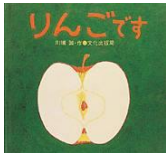
『りんごです』文化出版局