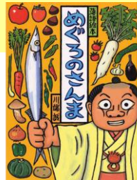
『めぐろのさんま』クレヨンハウス