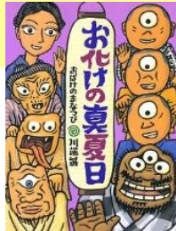
『お化けの真夏日』BL出版