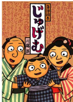
『じゅげむ』クレヨンハウス