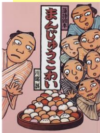
『まんじゅうこわい』クレヨンハウス