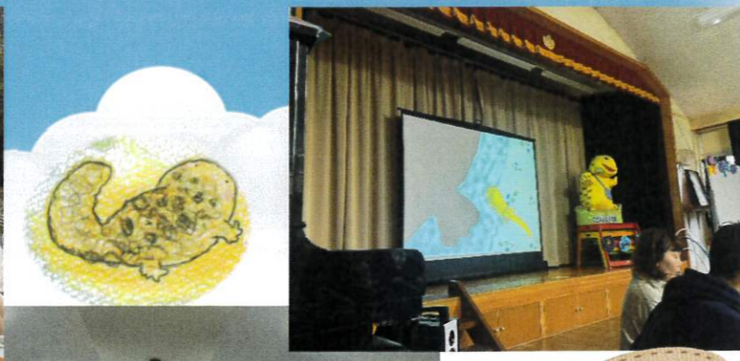
「ぼんぼん」のすてきなおはなし。