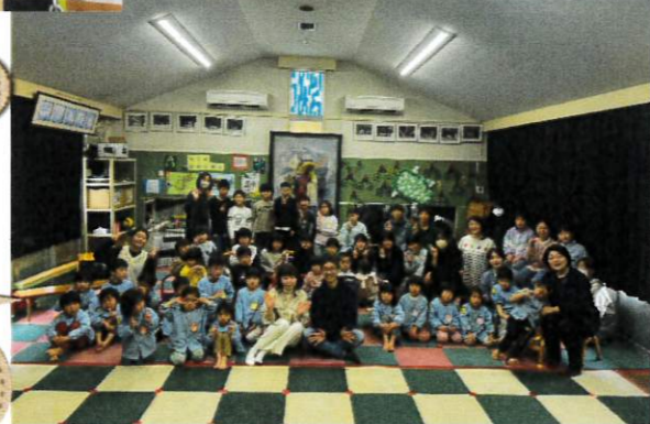
こども園ふたばのおともだちと。