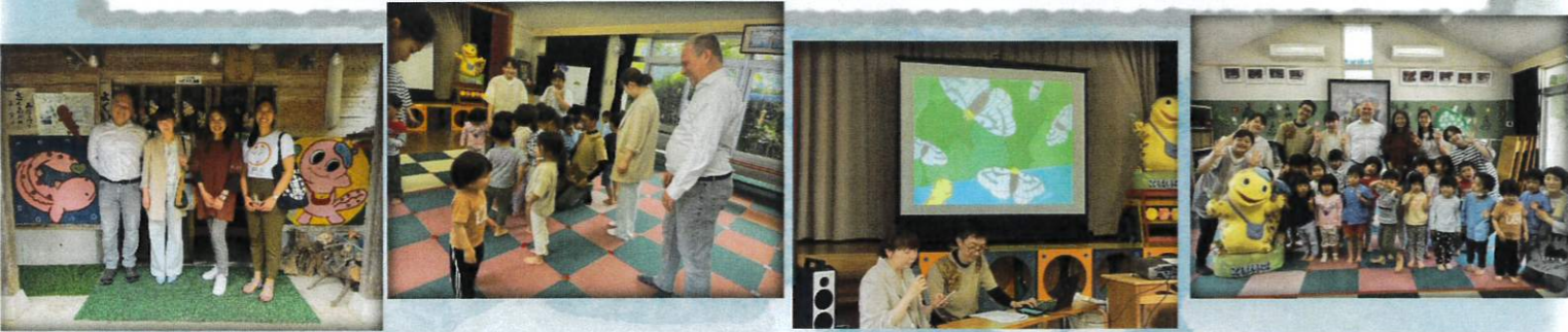
P4 ルンルン通信 2026年6月号