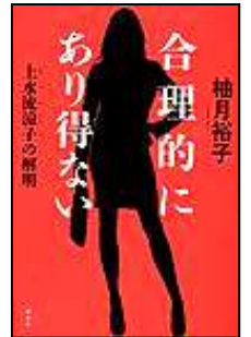
『合理的にあり得ない』 上水流涼子の解明 講談社 柳月 裕子/著