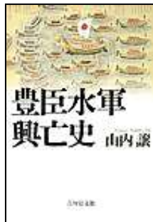
『豊臣水軍興亡史』 吉川弘文館 山内 譲/著