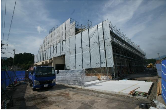
東面外観解体完了状況