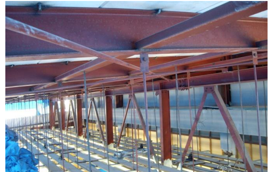
耐震補強屋根ブレース施工状況