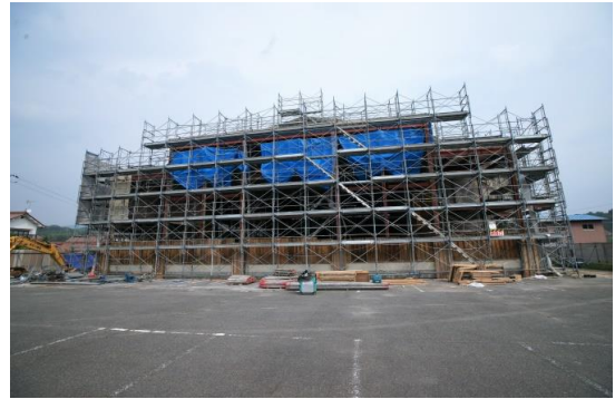
西面外観解体完了状況