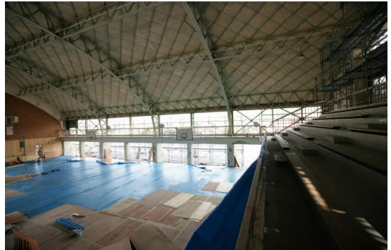
アリーナ北面解体完了状況