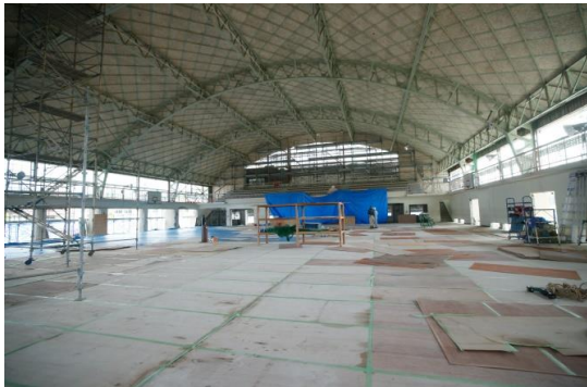
アリーナ東面解体完了状況