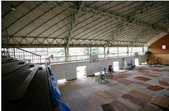
アリーナ南面解体完了状況