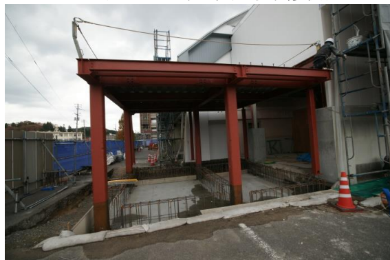
管理室増築部状況