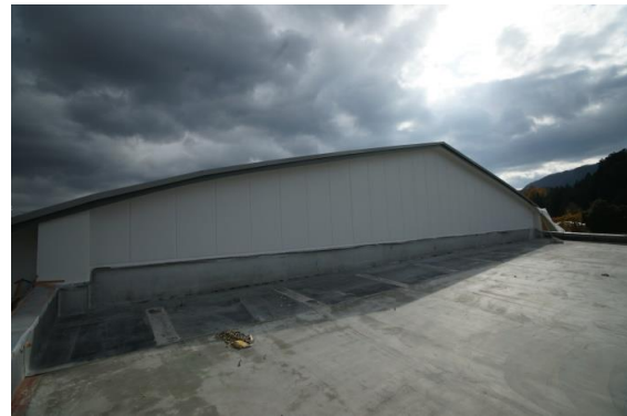
ステージ上部屋根廻り改修状況