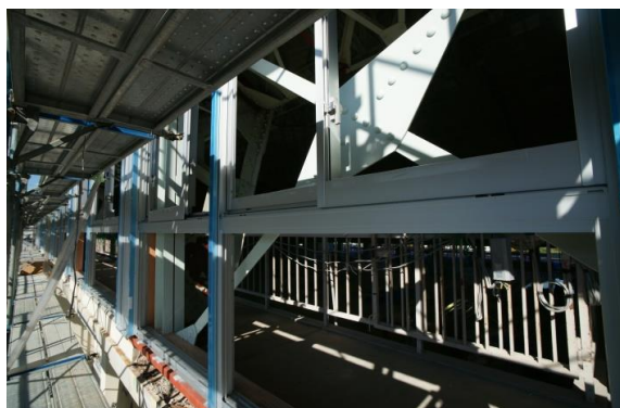
アリーナ南面2階改修状況