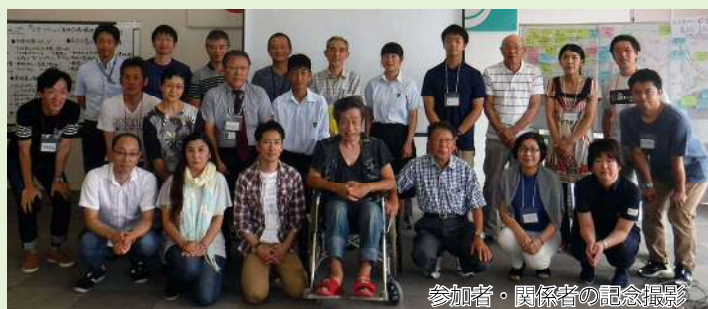
参加者・関係者の記念撮影