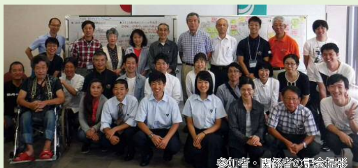
参加者・関係者の記念撮影

今回をもってワークショップはひとつの区切りとなります。今後は、いただいた意見をもとに計画を進めていきます。ご協力いただき、ありがとうございました。