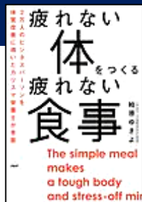
『疲れない体をつくる疲れない食事』 柏原 ゆきよ/著