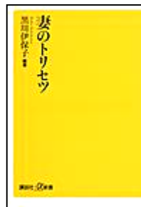
『妻のトリセツ』 黒川 伊保子/編著