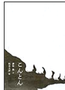
『こんとん』偕成社 ゆめまくら ぼく ぶん まつもと たいよう え 松本 大洋/絵