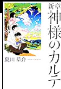
『新章 神様のカルテ』 小学館 夏川 草介/著