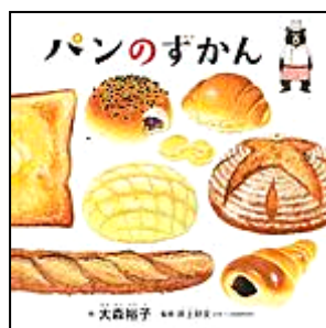
『パンのずかん』白泉社 おおもり ひろこ さく 大森 裕子/作 いのうえ よしらみ かんしゅう 井上 好文/監修