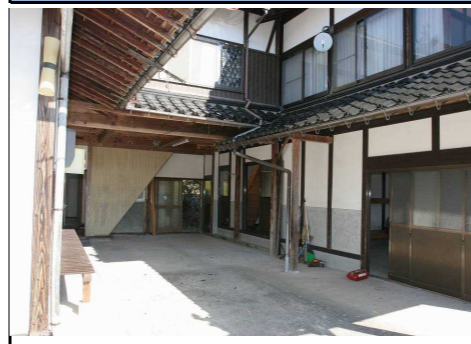
外観 主屋と納屋の間