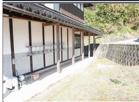
外観 納屋 東側