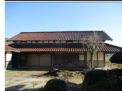
納屋 外観 北側