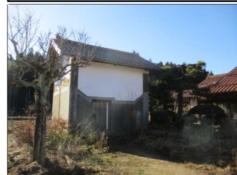
土蔵 外観 東側