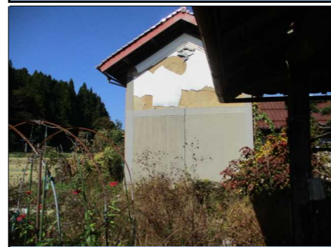
土蔵 外観 南側