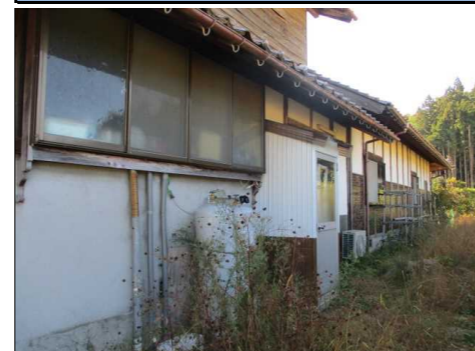
主屋 外観 北側