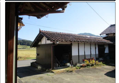
納屋 外観 西側