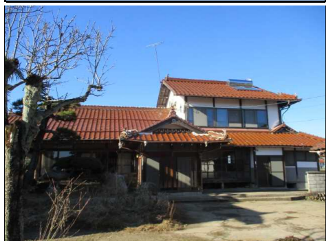
主屋 外観 南側