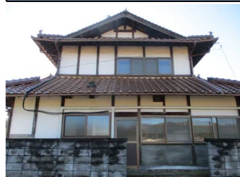
主屋 外観 東側