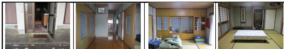
ポーチ・玄関 ホール 和室8帖 居間 和室8帖 客間