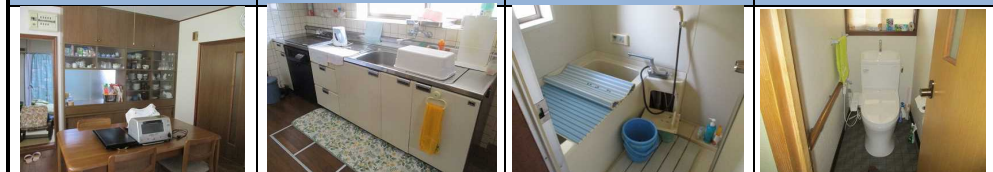
台所 流し台廻り 浴室 トイレ