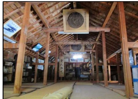
小屋裏物入 だて2階部