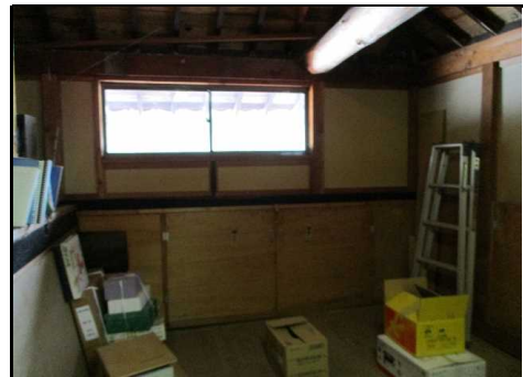
小屋裏物入 だて2階部