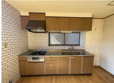
システムキッチン