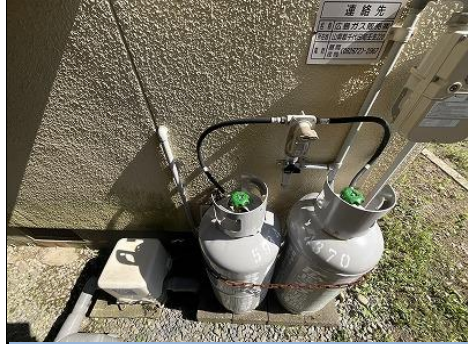
ガスボンベ設置状況