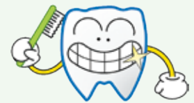
歯科保健センター 公式キャラクター ハッキー

令和8年度に、20・30・40・50・60・70・80歳の節目年齢を迎えられる方は、「歯周疾患検診」の対象者です。町内の歯科医院で使える「歯周疾患検診受診券」を送付します。 歯周病は歯を失うだけでなく、全身の健康に悪影響を与えます。 いつまでも健康な歯と口を保てるよう歯周疾患検診を受けましょう。