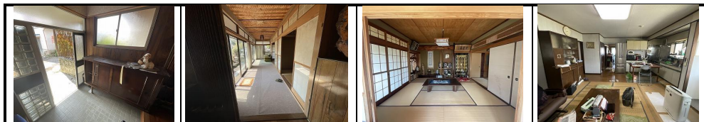
玄関 和室6帖次の間 和室8帖客間 居間