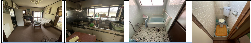
洋間 寢室 台所 浴室 トイレ水洗