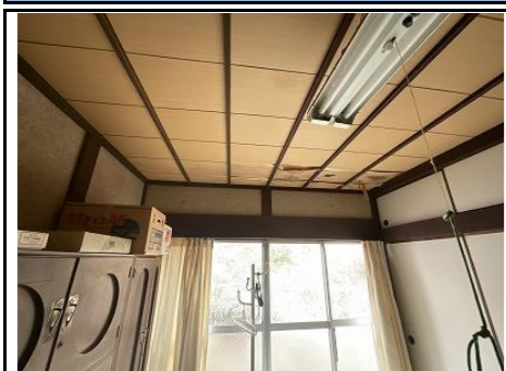
寢室 天井雨漏り跡