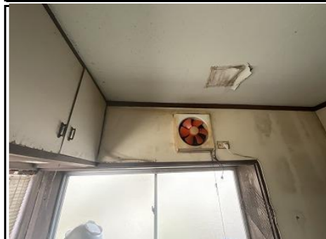
台所 天井雨漏り跡