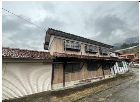
外観 別棟倉庫北側