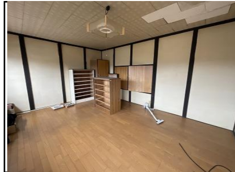
主屋2階和室10帖 (板張り)