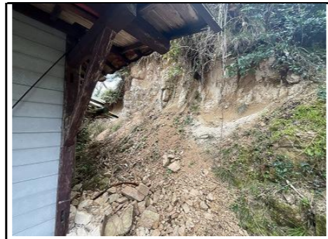
倉庫南側 斜面状況