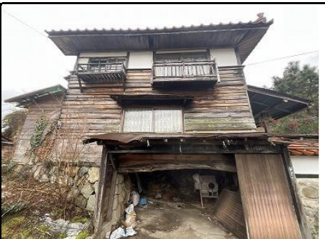
外観 別棟住居北側